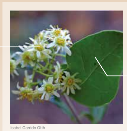
Isabel Garrido Otth

Ses fleurs femelles sont plus petites que ses fleurs mâles, elles sont parfumées et disposent de 5 pétales libres ; elles sont blanc jaunâtre.